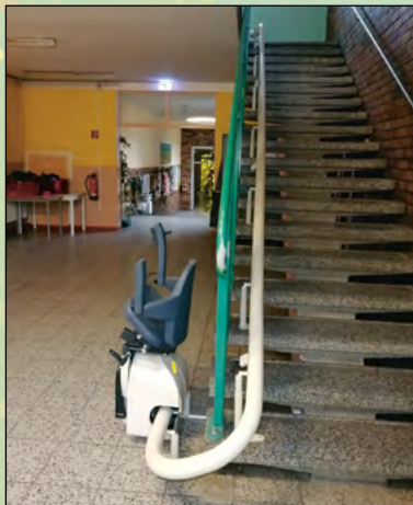
Einbau eines Treppenliftes in der Grundschule Mittelherwigsdorf