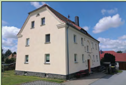
Fassadensanierung am kommunalen Wohngebäude Oberdorfstraße 118