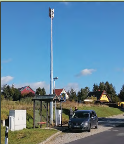
Kompletzierung des gemeindlichen Sirennennetzes um 5 zusätzliche Standorte