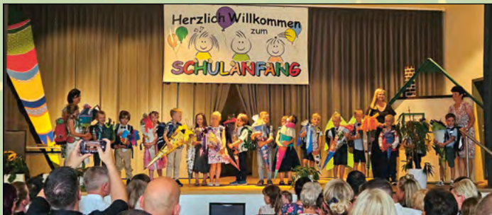
Einschulung von zwei 1. Klassen im Gütchen-Saal