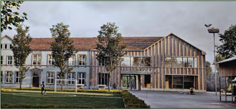
Siegerentwurf des Architektenwettbewerbes zur Umgestaltung unserer Grundschule