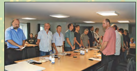
Vereidigung des neu gewählten Gemeinderates