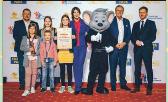
Auszeichnung von MITMACHherwigsdorf mit dem Deutschen Kinder- & Jugendpreis