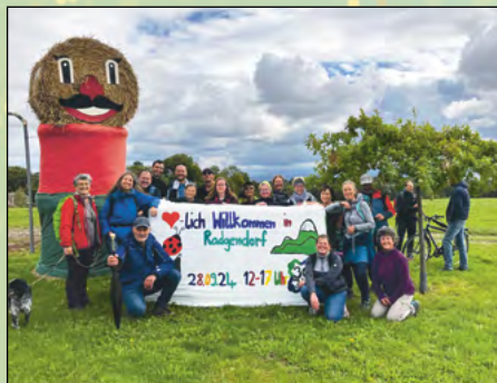
Tag des offenen Dorfes anlässlich 30 Jahre Einheitsgemeinde