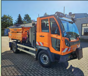
Ersatzbeschaffung Multicar mit Streuvorrichtung Bauhof Eckartsberg-Radgendorf