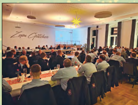
Jahreshauptversammlung der Gemeinde-Feuerwehr