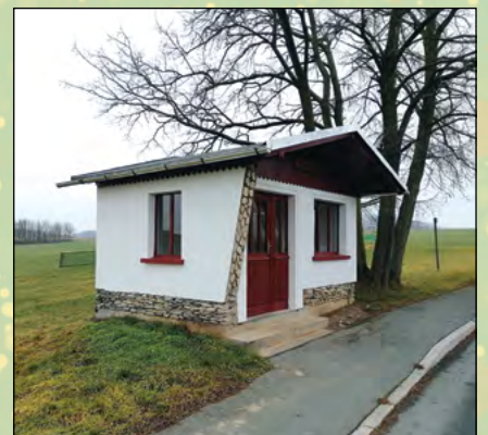
Sanierung Buswarte Halle Oberseifersdorf Viebig