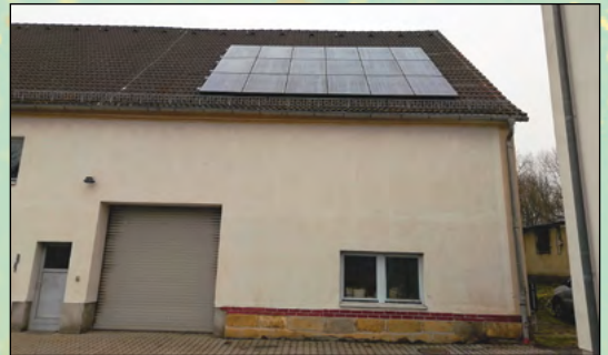
Installation einer PV-Anlage mit Speicher und Wallbox in den Bauhöfen Mittelherwigsdorf und Eckartsberg