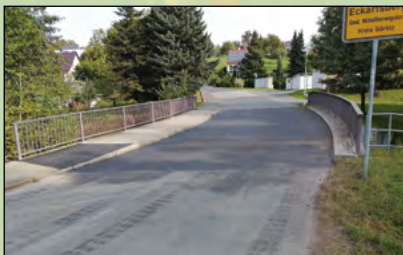
Instandsetzung der Brücke Neue Straße in Eckartsberg