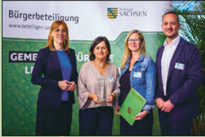
Auszeichnung des MITMACHherwigsdorf-Projektes mit dem Sächsischen Beteiligungspreis