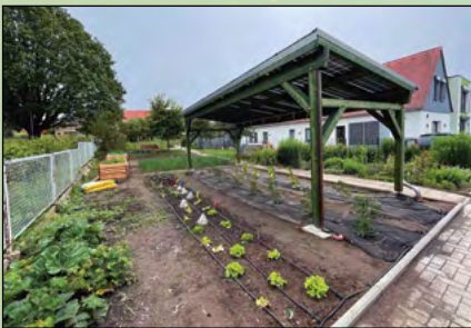
Schulgarten nach umfangreicher Umgestaltung