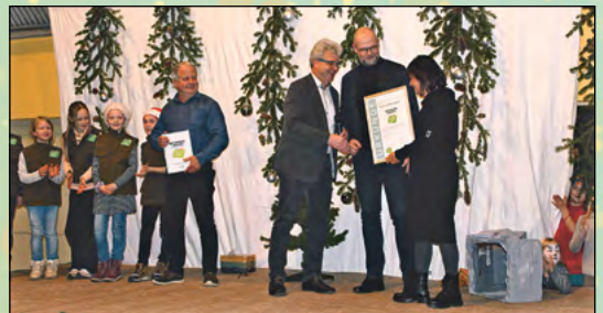
Ernennung unserer Grundschule zur 1. Naturparkschule