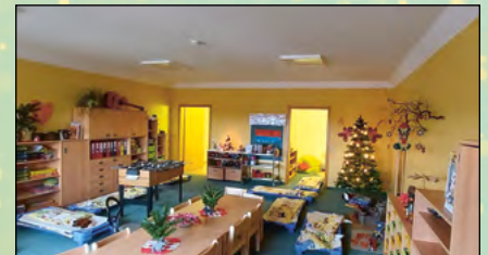
Renovierung, Einbau von Schallschutz und Neumbau eines Gruppenraumes im Kinderhaus Eckartsberg