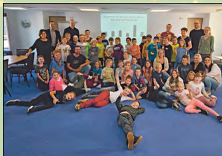
Teilnehmer der 4. Kinder-Ideenkonferenz