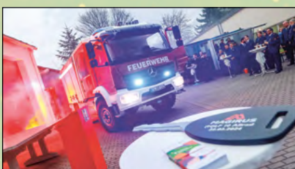
Übergabe des neuen Löschfahrzeuges der Feuerwehr Eckartsberg/Radgendorf