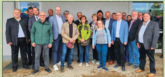
Besuch unserer Partnergemeinde Dischingen in Baden-Württemberg