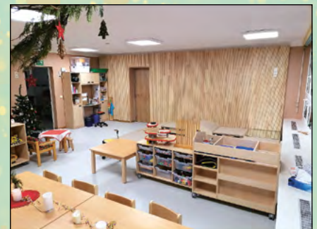
Renovierung, Einbau von Schallschutz und Neumbau eines Gruppenraumes im Kinderhaus Mittelherwigsdorf