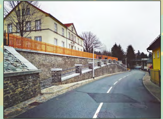
Sanierung der Stützmauer und Treppenanlage an der Grundschule Mittelherwigsdorf