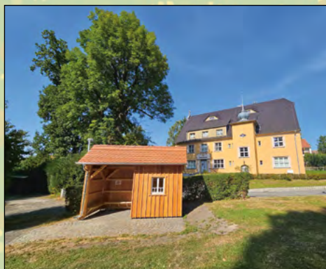
Errichtung einer Tausch-Bibliothek am Gemeindeamt