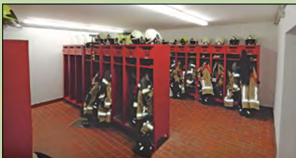
Umgestaltung der Umkleebereiche der Feuerwehr Mittelherwigsdorf