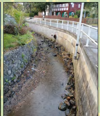
Gewässerunterhaltung am Eckartsbach in Oberseifersdorf