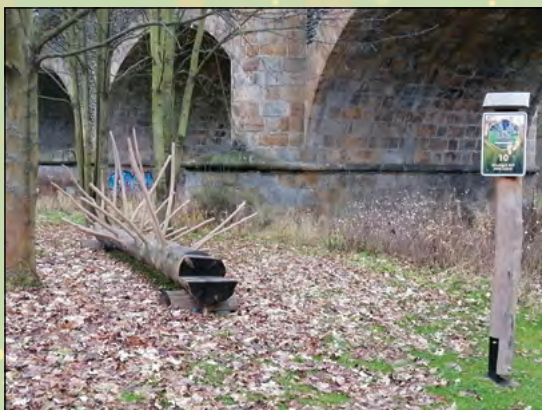
Erweiterung und Neubeschilderung des Barfußweges